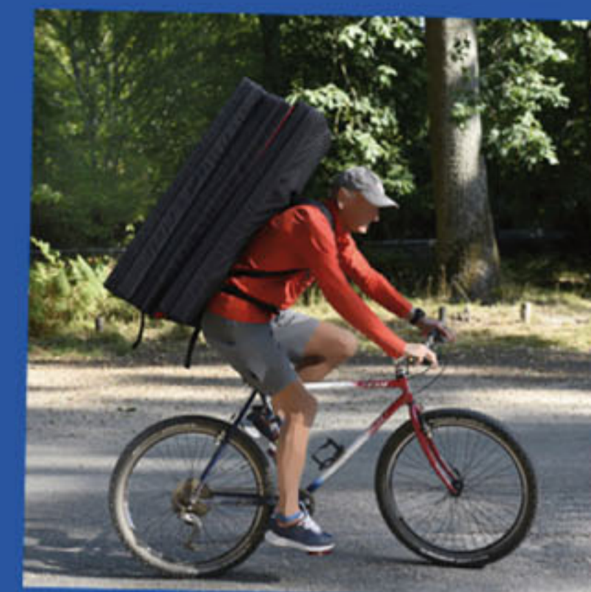
Ceintures ventrale et pectorale